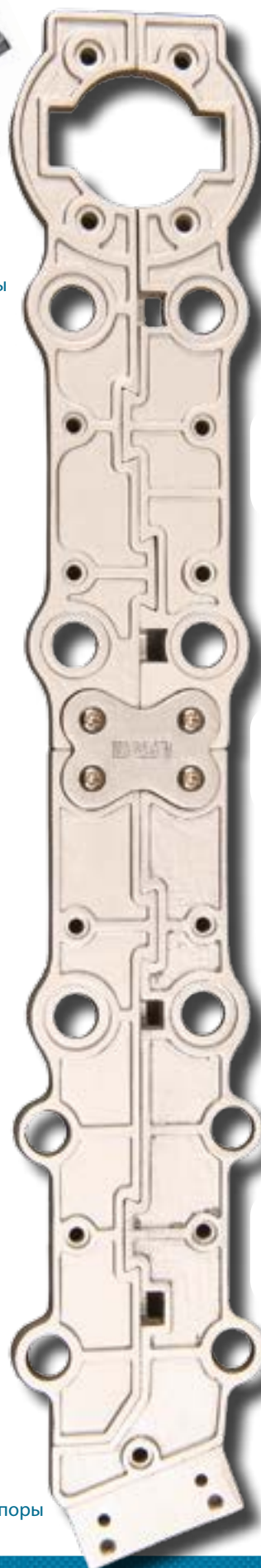
LFR-14: фрагмент каркаса опоры